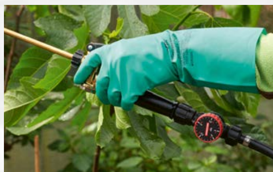
PR 3 montiert zwischen Handventil und Schlauch. PR 3 monté entre la poignée et le tuyau.

ment de la pression qui se trouve dans le pulvérisateur. Une pression plus élevée est réglée à la valeur pré-réglée. La pression étant toujours constante, le débit reste le même et la pulvérisation est uniforme. Si la pression est inférieure à celle réglée, le débit s'arrête. Si l'utilisateur souhaite désactiver la régulation de la pression, il suffit d'ouvrir le bypass de la vanne. De cette manière, la pression de l'appareil peut également être complètement supprimée pour la vidange et le nettoyage. La valve régulatrice de pression PR 3 peut être montée ultérieurement sur les appareils Flox 10 et Iris 15 et fait désormais partie de l'équipement standard des pulvérisateurs à pression préalable Profi Star 5 et 3.