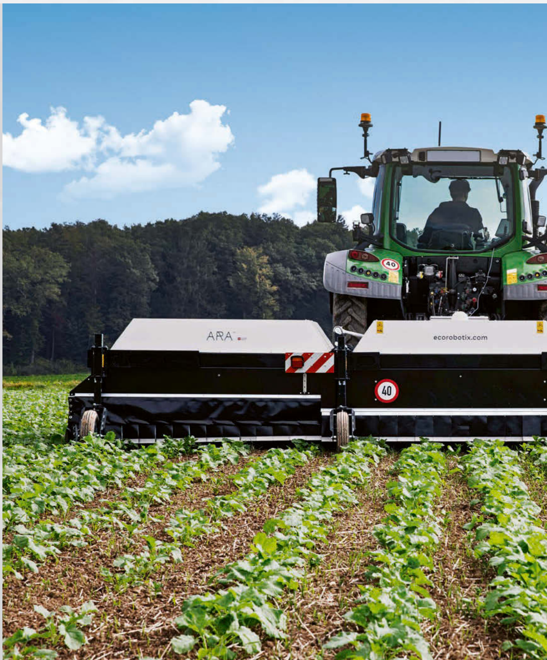
Zunehmend kommt der ARA im Ackerbau zum Einsatz. ARA est de plus en plus utilisé dans les cultures.

Un tracteur de 90 ch suffit pour utiliser le pulvérisateur. C'est la prise de force arrière qui fait fonctionner l'ARA, et le produit de pulvérisation provient du réservoir avant. Avec une largeur de travail de 6 mètres (un engin plus étroit est en cours de développement) et une vitesse de déplacement de 7 km/h, on