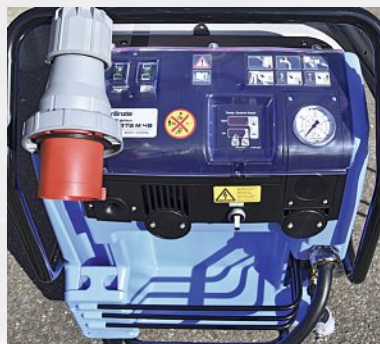
Nahaufnahme des neuen Heisswasser-Hochdruckreiniger von Kränzle.