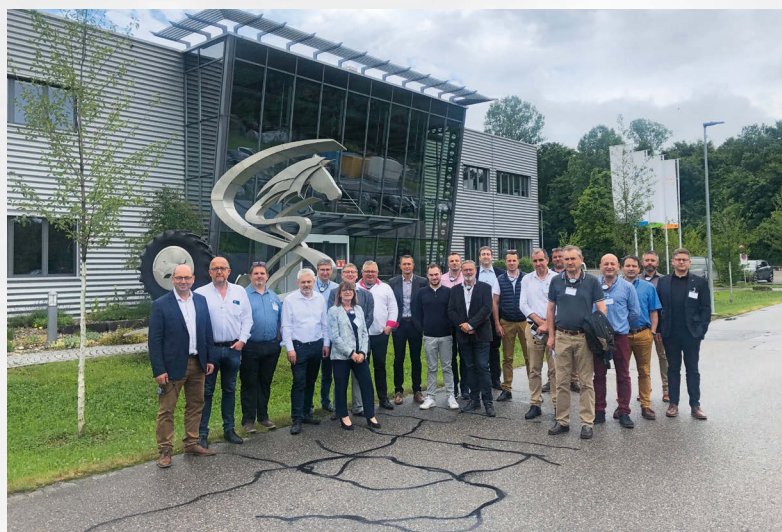
Besuch der Sedima-Delegation am Bildungszentrum Aarberg.

Visite de la délégation Sedima au centre de formation à Aarberg.