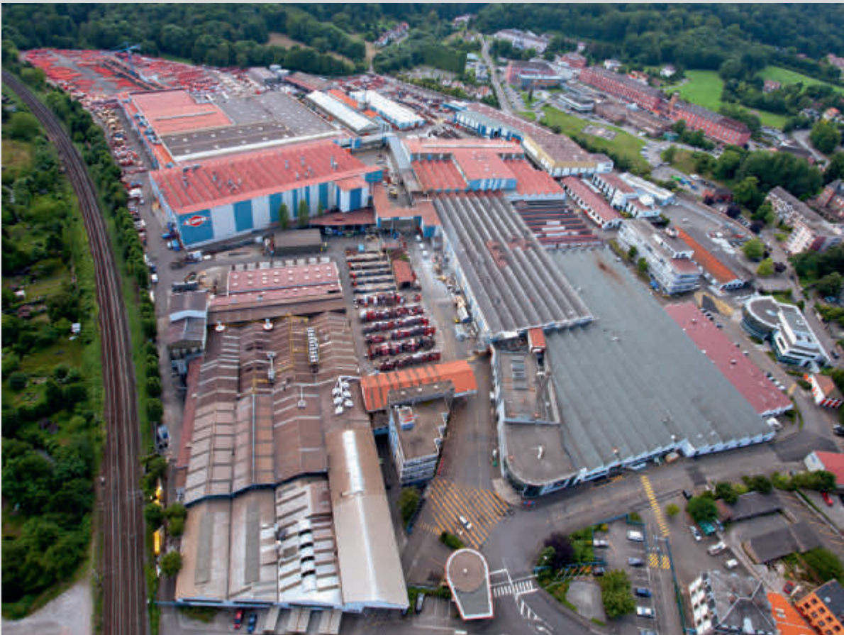
Die Produktion der Kuhn Gruppe in Saverne (F) wurde vorübergehend gestoppt. La production du groupe Kuhn à Saverne (F) a été temporairement mise à l'arrêt.