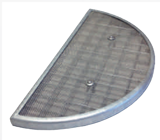
Gitterrost mit integriertem Insektenschutzgitter Grille caillebotis avec moustiquaire intégrée