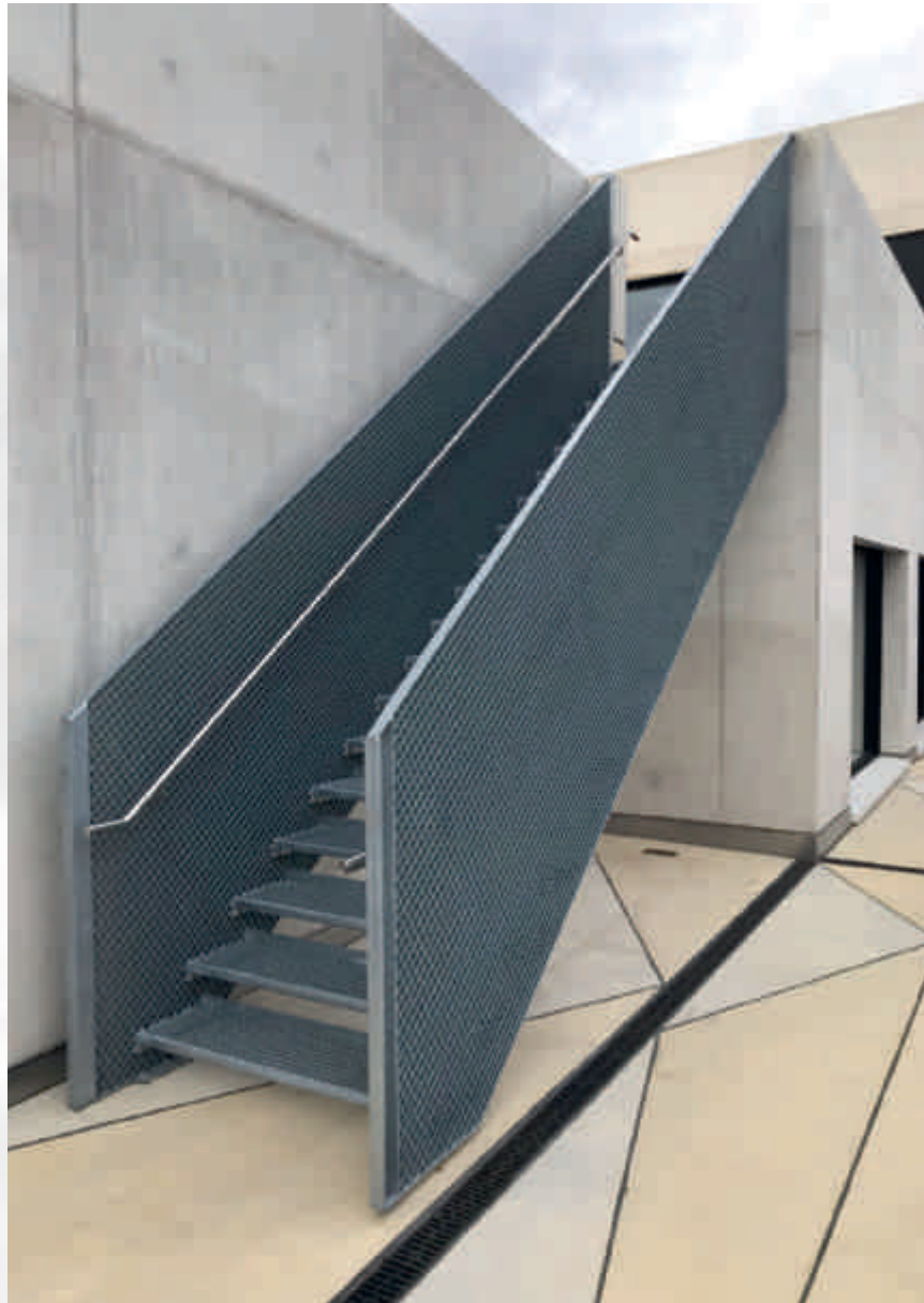
Treppenwangen aus Gitterrosten

Das unangenehme Putzen im Lichtschacht ist eine lästige Tätigkeit, die dank massgefertigtem Schutz ein für alle Mal der Vergangenheit angehört. Mit den feinmaschigen Lichtschachtdeckungen der Firma Rieder & Co. AG, erhalten Sie eine individuell, nach Mass, gefertigte Lösung für Ihren Kellerschacht. Jeder kennt das unangenehme Problem mit Lichtschächten: Spinnweben, Laub und Insekten machen immer wieder eine aufwendige Reinigung erforderlich. Hochwertige Abdeckungen schaffen hier Ab-