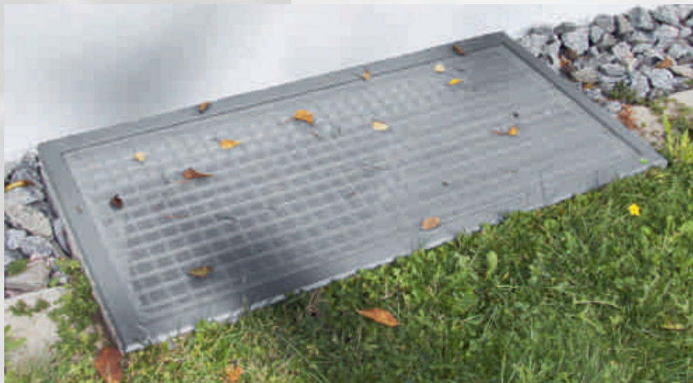
Lichtschachtabdeckung Couverture de puits de lumière