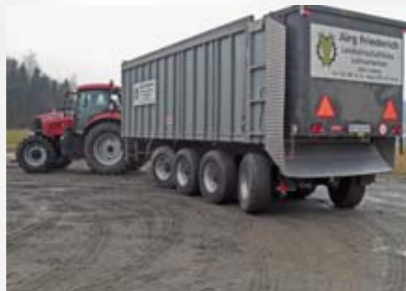
Auf dem Kiesplatz wird die Lenkgeometrie optimiert.

La géométrie de guidage est optimisée sur un terrain en gravier.