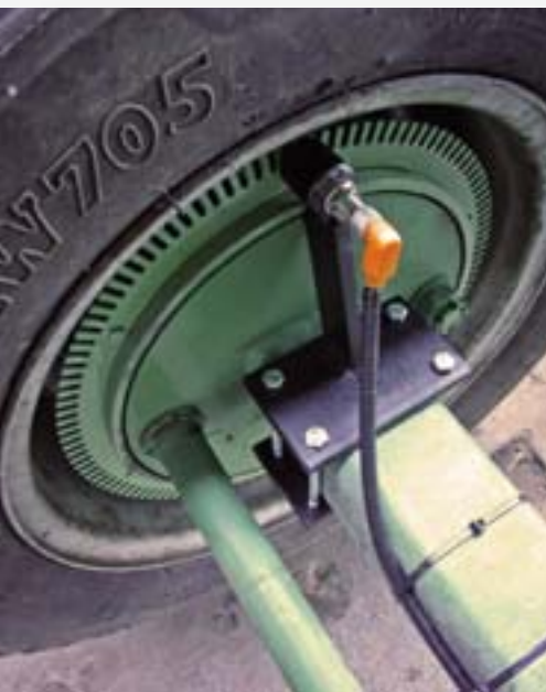
Bild links: Reflektorscheibe und Induktivgeber zur Erfassung des Geschwindigkeitssignals.

Image gauche: Disque réflecteur et capteur inductif pour la saisie du signal de vitesse.