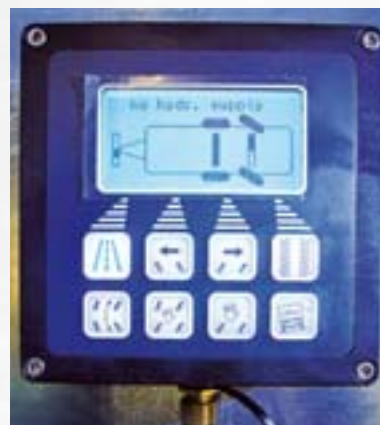
Die Bedien- und Anzeigeeinheit.

Die Bedienung des gesamten Lenksystems erfolgt über eine Bedien- und Anzeigeeinheit, welche in der Traktorkabine montiert wird. Die