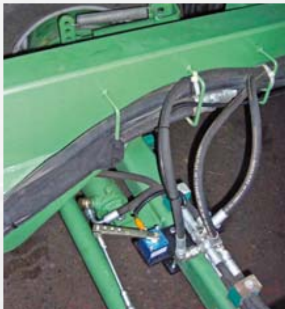
Bild rechts: Ein Drehwinkelgeber erfasst den eingeschlagenen Lenkwinkel am Rad.

Image gauche: Disque réflecteur et capteur inductif pour la saisie du signal de vitesse.