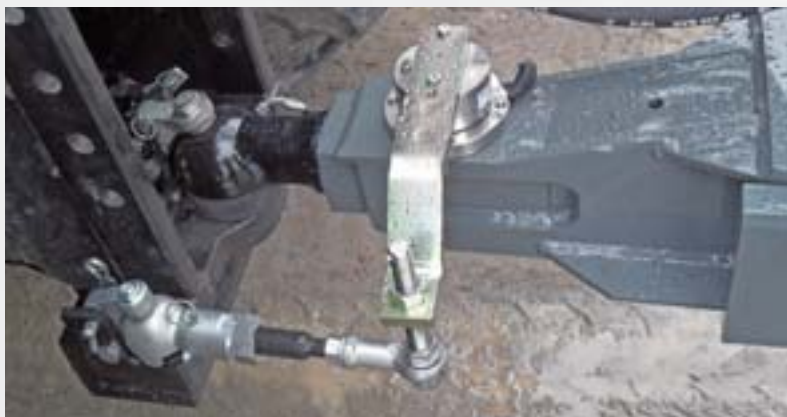
Scharmüller Kugelkupplung K80 mit Kugelkupplung K50 angeordnet nach der DIN-Norm 26402. Attelage à boule Scharmüller K80 avec attelage à boule K50 selon la norme DIN 26402.

An unserem Tridem-Anhänger war die Sicherheit mit der ursprünglich montierten Lenkung nicht mehr gewährleistet. Der Reifenverschleiss war viel zu hoch. Nach eineinhalb Jahren waren unsere 26.5"-Reifen schon flach. Dies geschah, weil die Lenkwinkel in den Kurven nicht