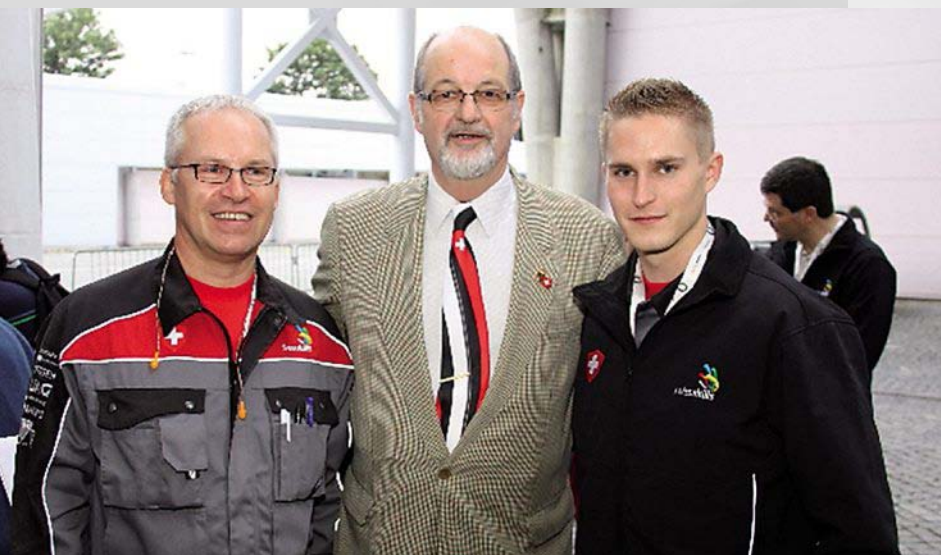
Besuch vom Schweizer Botschafter in Portugal. La visite de l'Ambassadeur suisse au Portugal.

EuroSkills 2010 wurde unter der Leitung von ESPO (European Skills Promotion Organisation) und federführend von Skills-Portugal vom 9. – 12. Dezember in Lissabon durchgeführt.